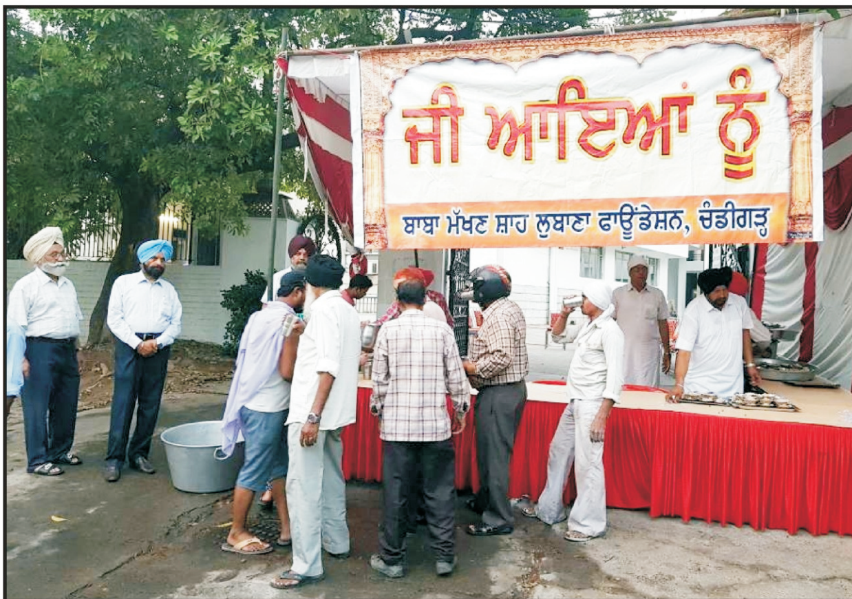
ਮਿਤੀ 27-05-2017 ਨੂੰ ਸ੍ਰੀ ਗੁਰੂ ਅਰਜਨ ਦੇਵ ਜੀ ਦੇ ਸ਼ਹੀਦੀ ਦਿਹਾੜੇ 'ਤੇ ਨਗਰ ਕੀਰਤਨ 'ਤੇ ਛਬੀਲ ਦੀ ਸੇਵਾ ਕਰਦੇ ਹੋਏ ਪ੍ਰਧਾਨ ਜੀ ਅਤੇ ਹੋਰ ਮੈਂਬਰ ਸਾਹਿਬਾਨ