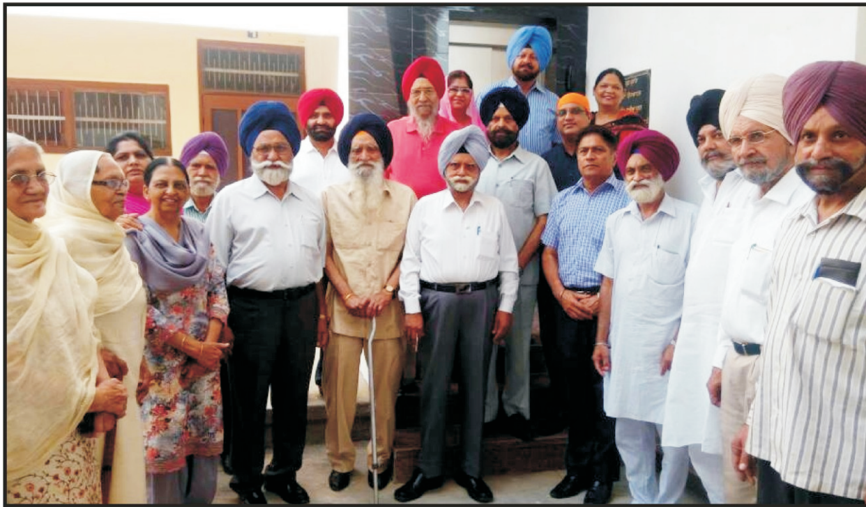
ਮਿਤੀ 14-05-2017 ਨੂੰ ਸੰਗਰਾਂਦ ਦੇ ਦਿਹਾੜੇ 'ਤੇ ਲਿਫਟ ਦਾ ਉਦਘਾਟਨ ਕਰਦੇ ਹੋਏ ਪ੍ਰਧਾਨ, ਜਨਰਲ ਸਕੱਤਰ ਅਤੇ ਹੋਰ ਮੈਂਬਰ ਸਾਹਿਬਾਨ।