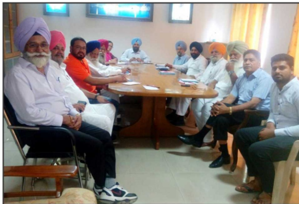
Regional President Meeting on 27-09-17