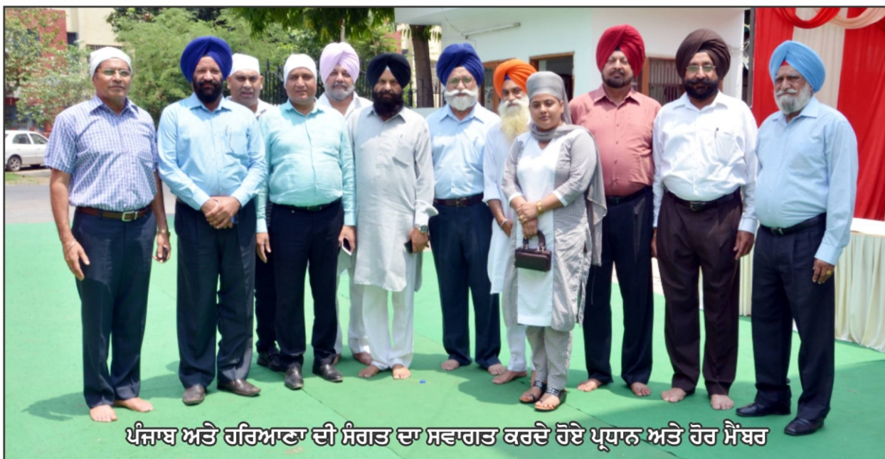
ਪੰਜਾਬ ਅਤੇ ਹਰਿਆਣਾ ਦੀ ਸੰਗਤ ਦਾ ਸਵਾਗਤ ਕਰਦੇ ਹੋਏ ਪ੍ਰਧਾਨ ਅਤੇ ਹੋਰ ਮੈਂਬਰ