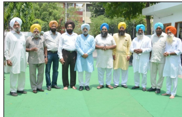
ਪੰਜਾਬ ਅਤੇ ਹਰਿਆਣਾ ਦੀ ਸੰਗਤ ਦਾ ਸਵਾਗਤ ਕਰਦੇ ਹੋਏ ਪ੍ਰਧਾਨ ਅਤੇ ਹੋਰ ਮੈਂਬਰ