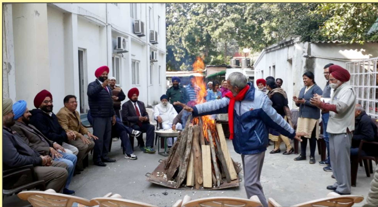
ਬਾਬਾ ਮੱਖਣ ਸ਼ਾਹ ਲੁਬਾਣਾ ਫਾਊਂਡੇਸ਼ਨ (ਰਜਿ.) ਚੰਡੀਗੜ੍ਹ ਦੇ ਅਹੁਦੇਦਾਰਾਂ ਅਤੇ ਮੈਂਬਰਾਂ ਵੱਲੋਂ ਧੀਆਂ ਦੀ ਲੋਹੜੀ ਮਨਾਈ ਗਈ