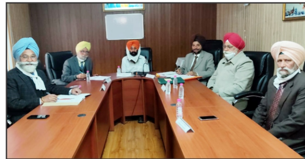
Meeting of Adhoc Committee being held on 01-02-2021