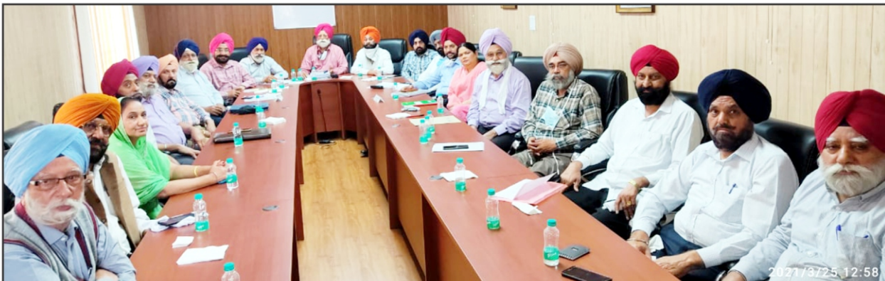
Meeting of Election Committee and Candidates for Election of President being held on 25-03-2021 at BMSLF Bhawan Chandigarh