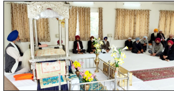
Occasion of Magh month Sangrand on 14-01-2021 at Gurughar, BMSLF Bhawan Chandigarh