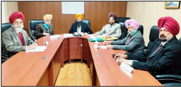
Meeting of Adhoc Committee being held on 28-12-2020 at BMSLF Bhawan Chandigarh