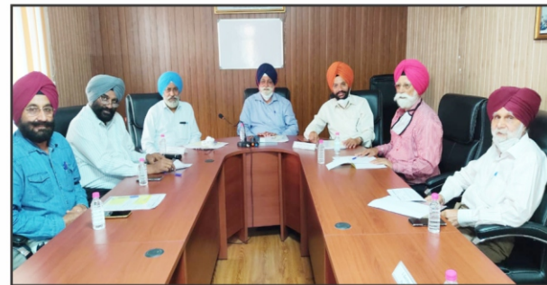
First Meeting of the Election Committee to elect the Chairperson being held on 11-03-2021