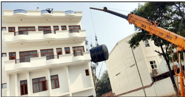
5000 Litre Capacity Water tank to be kept reserve for Fire Fighting being lifted by a crane for installation at roof of BMSB Block in BMSLF Bhawan Chd.